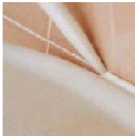
Герметизация швов между облицовкой и сантехникой