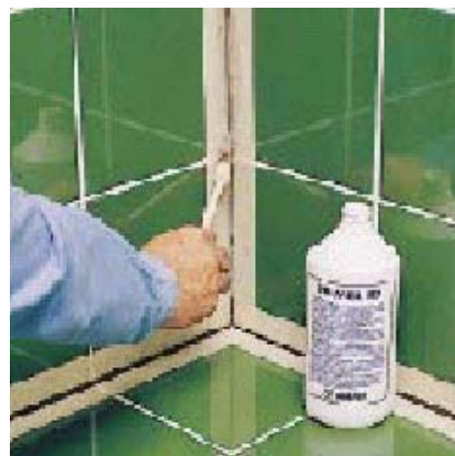
Нанесение PRIMER FD