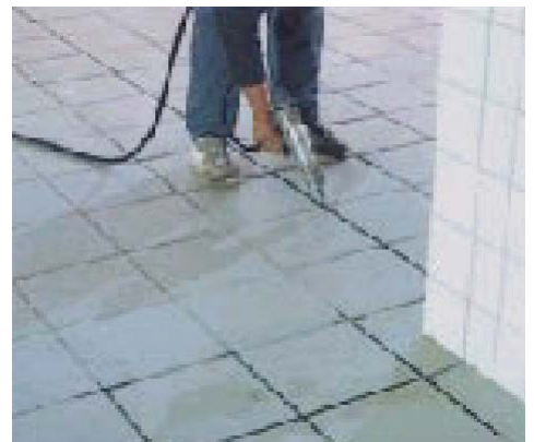
Заполнение швов в керамической облицовке