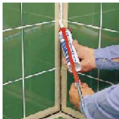
Нанесение MAPESIL AC