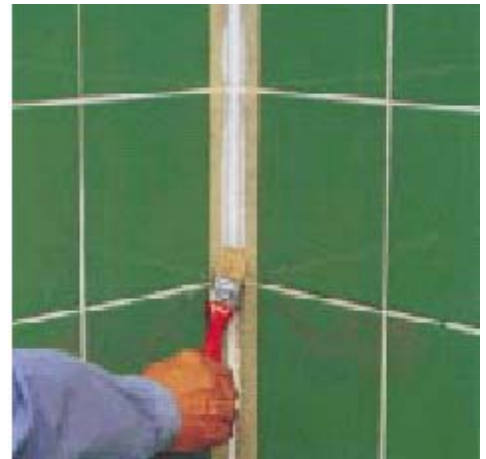
Разглаживание соединения кистью