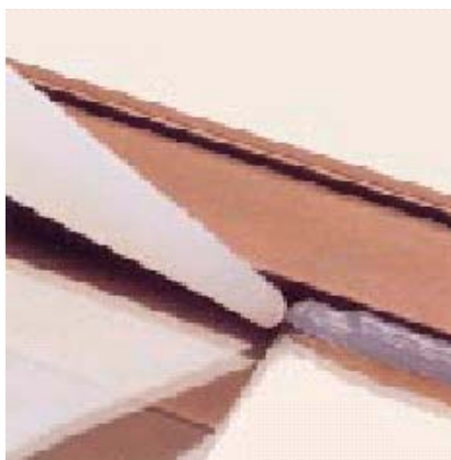
Уплотнение алюминиевой оконной рамы