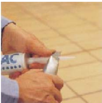
Обрезка сопла под размер шва

При предварительной обработке поверхности грунтовкой PRIMER FD MAPESIL AC может быть уложен на мрамор, цемент, природный камень, дерево, краску, пластмассу, резину и т.д.