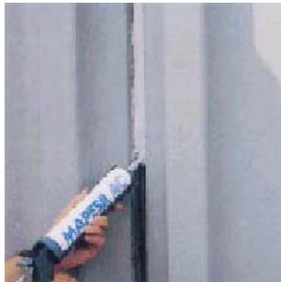
Заполнение швов между блоками сборного железобетона