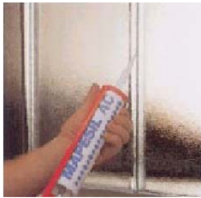
Уплотнение двойных блоков

ТОЛЬКО ДЛЯ ПРОФЕССИОНАЛЬНОГО ИСПОЛЬЗОВАНИЯ