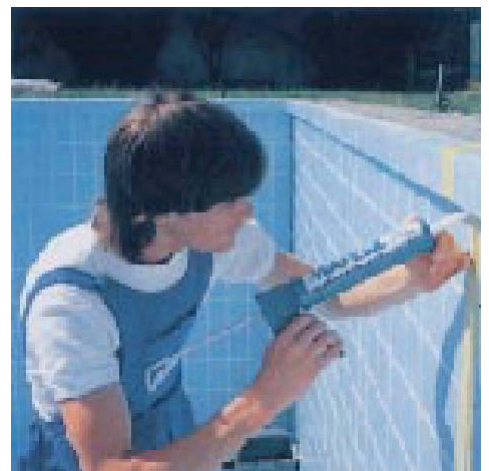
Заполнение термокомпенсационного шва плавательного бассейна