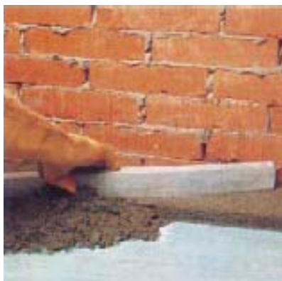
Стяжка с PLANICRETE