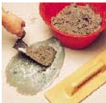
Нанесение выравнивающего раствора