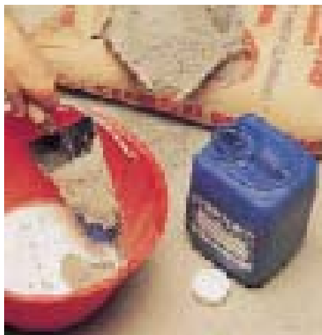
Смешивание цементного раствора с PLANICRETE