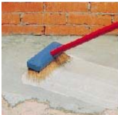
Нанесение адгезионного раствора