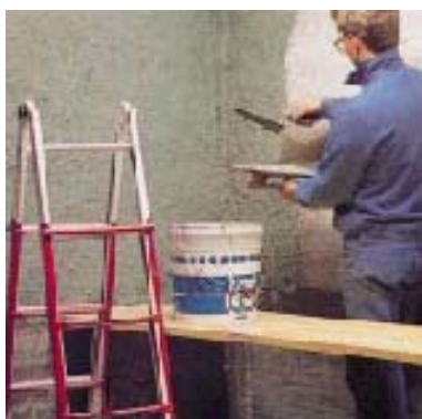
Нанесение штукатурного раствора с использованием PLANICRETE

Основание должно быть чистой и твердой, очищенной от веществ, препятствующих нормальному сцеплению (пыль, грязь, остатки цемента, краска, масло, резиновая крошка, отслаивающийся асфальт и т.д.).