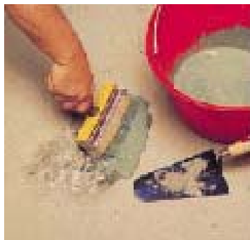
Нанесение адгезионного раствора